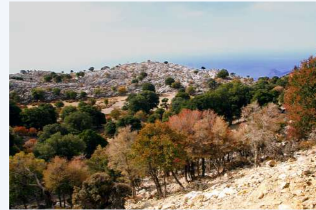
Οικότοπος αμπελιτσιάς - Δίκτη, Πρωτολιτσά (18)

Τα άτομα σε θαμνώδη μορφή δεν παράγουν σπέρματα και μπορεί να είναι αρκετών εκατοντάδων ετών, υποδηλώνοντας λίγο πολύ συνεχή και μακροχρόνια επίδραση φυτοφάγων ζώων (Sarlis 1987, Fazan et al. 2012).