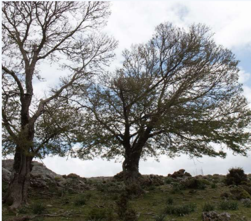
Αμπελιτσιά σε δενδρώδη μορφή - Λευκά Όρη, Ίμβρος (3)

ΠΡΟΣΔΙΟΡΙΣΜΟΣ ΠΕΡΙΣΣΟΤΕΡΩΝ ΣΤΡΑΤΗΓΙΚΑ σημαντικών ατόμων αμπελιτσιάς προς περίφραξη,