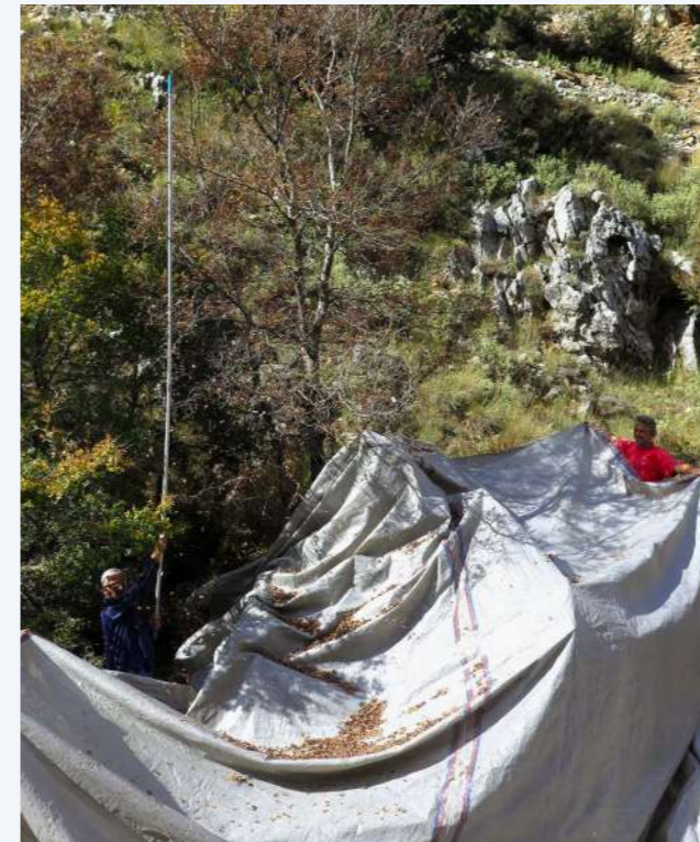
Συλλογή σπερμάτων αμπελιτσιάς, Λευκά Όρη, Ομαλός, Εκτός τόπου δράσεις διατήρησης (4)

ΔΗΜΙΟΥΡΓΙΑ ΔΙΚΤΥΟΥ ΜΙΚΡΟΑΠΟΘΕΜΑΤΩΝ ΦΥΤΩΝ για την προστασία του είδους σε μικρές εκτάσεις που έχουν ιδιαίτερη φυσική και περιβαλλοντική αξία, όπως υψηλός ενδημισμός και παρουσία σπάνιων ειδών (για παραδείγματα βλέπε: http://www.plantnet.org.cy/plant_micro-reserves.html , http://cretaplant.biol.uoa.gr/en/pmr.html ). Οι δράσεις για την ίδρυση των μικροαποθεμάτων θα πρέπει να γίνουν σε συνεργασία με την Αποκεντρωμένη Διοίκηση Κρήτης, τις τοπικές Διευθύνσεις Δασών, τους τοπικούς Δήμους και φορείς και τους χρήστες γης.