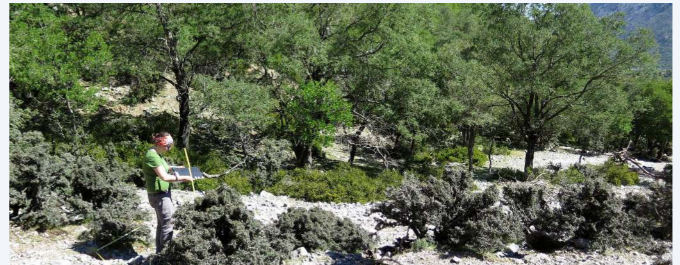
Αμπελιτσιά σε θαμνώδη και δενδρώδη μορφή - Λευκά Όρη, Ομαλός (19)

Η διάβρωση του εδάφους είναι η δεύτερη σημαντικότερη απειλή που ξεκάθαρα σχετίζεται με την υπερβόσκηση και την ποδοπάτηση. Η κλιματική αλλαγή, η ξηρασία, οι δασικές πυρκαγιές και η έλλειψη περιβαλλοντικής ευαισθητοποίησης είναι άλλες σημαντικές απειλές. Επιπλέον, η εμπορευματοποίηση της κατσούνας είναι ένας ακόμη λόγος για τη μείωση του αριθμού των μεγάλων δένδρων (Bauer and Bergmeier, 2011, Egli, 1997, Kozłowski et al., 2012, Sarlis, 1987). Παρά τις απειλές που αντιμετωπίζει και τη σπανιότητά της, η αμπελιτσιά αποτελεί βασικό στοιχείο των κρητικών βουνών. Όχι μόνο δημιουργεί ένα μοναδικό οικοσύστημα πάνω στα κλαδιά, το φλοιό και τις ρίζες της για πολυάριθμους και ελάχιστα μελετημένους οργανισμούς, όπως οι επιφυτικές λειχήνες και τα βρυόφυτα (Fazan et al., 2021d), τα μικρά θηλαστικά, τα μικροαρθρόποδα και τα πουλιά, αλλά ταυτόχρονα διαμορφώνει το περιβάλλον παρέχοντας ιδανικές συνθήκες ανάπτυξης για πολλά σπάνια ή ενδημικά φυτά των κρητικών βουνών.