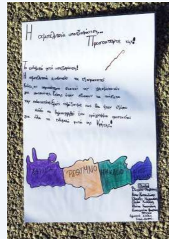
Μαθητικές δημιουργίες Δράσεις ενημέρωσης και ευαισθητοποίησης (5)

ΕΝΗΜΕΡΩΣΗ ΚΑΙ ΔΙΑΔΟΣΗ ΕΠΙΚΟΙΝΩΝΙΑΚΟΥ ΥΛΙΚΟΥ σε Μέσα Μαζικής Ενημέρωσης σε τοπικό και περιφερειακό επίπεδο.