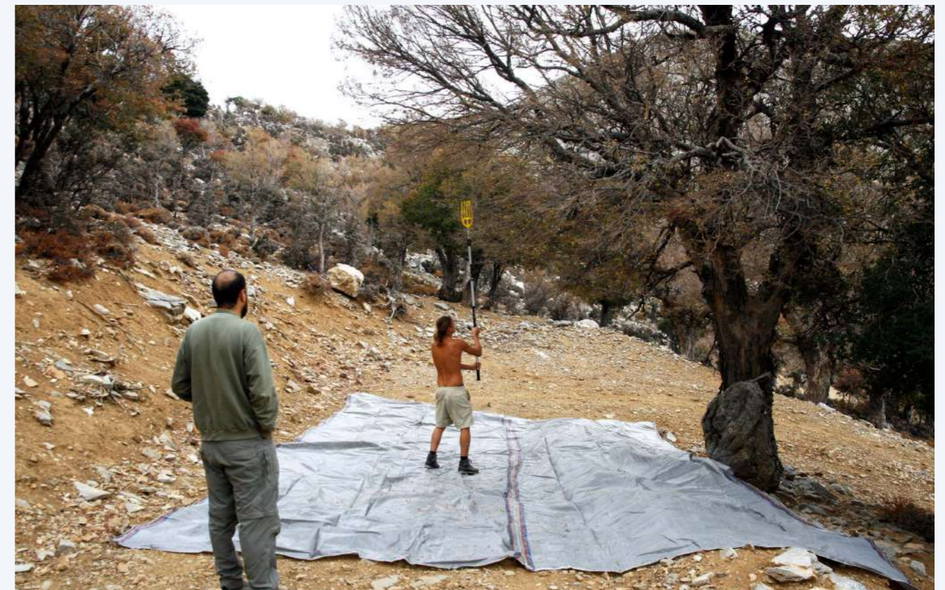
Συλλογή σπερμάτων αμπελιτσιάς (17)