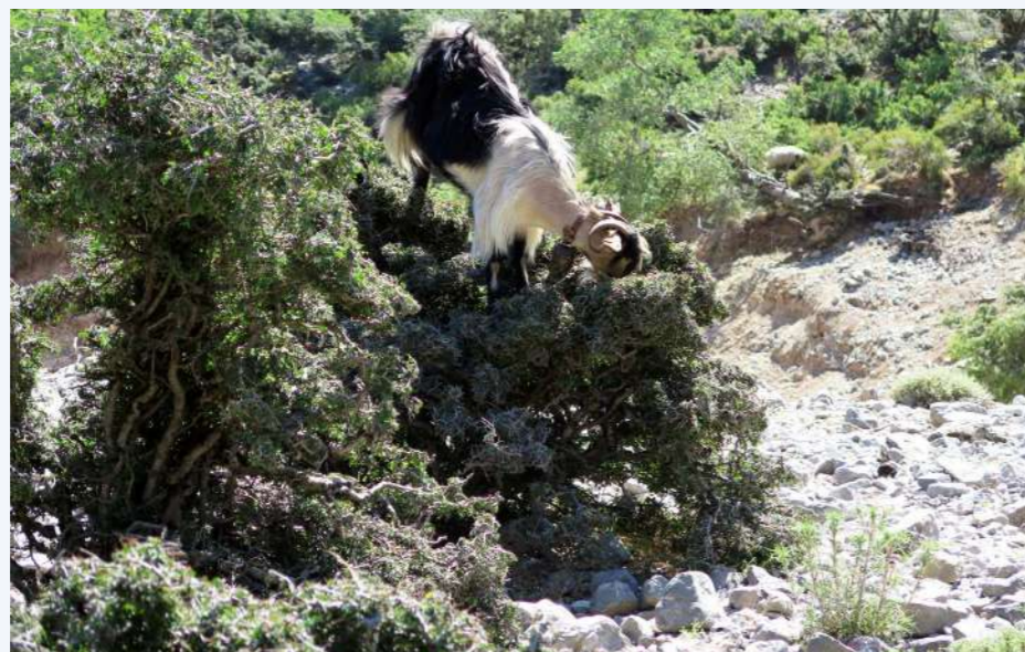
Υπερβόσκηση από κατσίκες (21)

Δεδομένων των απειλών που αντιμετωπίζει, η αμπελιτσιά προστατεύεται από την εθνική νομοθεσία (Προεδρικό Διάταγμα 67/81) που απαγορεύει τη χρήση και τη συλλογή υλικού από αυτήν (Fournaraki and Thanos, 2006, Rackham and Moody, 1996) και περιλαμβάνεται στο Βιβλίο Ερυθρών Δεδομένων της Ελλάδας (Phitos et al. 1995). Με βάση τον Διεθνή Οργανισμό για τη Διατήρηση της Φύσης (IUCN, 2012) θεωρείται είδος Κινδυνεύον (Endangered) με εξαφάνιση (Kozłowski et al., 2012). Περιλαμβάνεται στο Παράρτημα II της Οδηγίας για τους Οικοτόπους και στο Παράρτημα 1 της Σύμβασης για τη Διατήρηση της Άγριας Ζωής και των Φυσικών Οικοτόπων της Ευρώπης (Σύμβαση της Βέρνης). Σχεδόν όλοι οι πληθυσμοί του είδους περιλαμβάνονται στις περιοχές Natura 2000 GR4320002, GR4320005, GR4330002, GR4330005 και GR4340008.