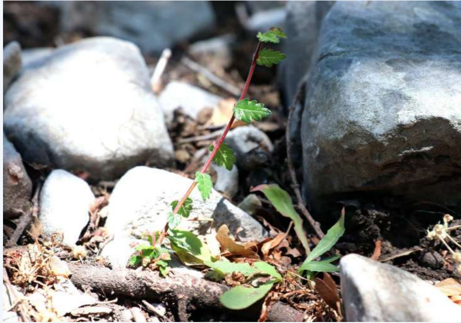
Παραβλαστήματα που εκφύονται από τις ρίζες αμπελιτσιάς (20)

Δεδομένων των απειλών που αντιμετωπίζει, η αμπελιτσιά προστατεύεται από την εθνική νομοθεσία (Προεδρικό Διάταγμα 67/81) που απαγορεύει τη χρήση και τη συλλογή υλικού από αυτήν (Fournaraki and Thanos, 2006, Rackham and Moody, 1996) και περιλαμβάνεται στο Βιβλίο Ερυθρών Δεδομένων της Ελλάδας (Phitos et al. 1995). Με βάση τον Διεθνή Οργανισμό για τη Διατήρηση της Φύσης (IUCN, 2012) θεωρείται είδος Κινδυνεύον (Endangered) με εξαφάνιση (Kozłowski et al., 2012). Περιλαμβάνεται στο Παράρτημα II της Οδηγίας για τους Οικοτόπους και στο Παράρτημα 1 της Σύμβασης για τη Διατήρηση της Άγριας Ζωής και των Φυσικών Οικοτόπων της Ευρώπης (Σύμβαση της Βέρνης). Σχεδόν όλοι οι πληθυσμοί του είδους περιλαμβάνονται στις περιοχές Natura 2000 GR4320002, GR4320005, GR4330002, GR4330005 και GR4340008.