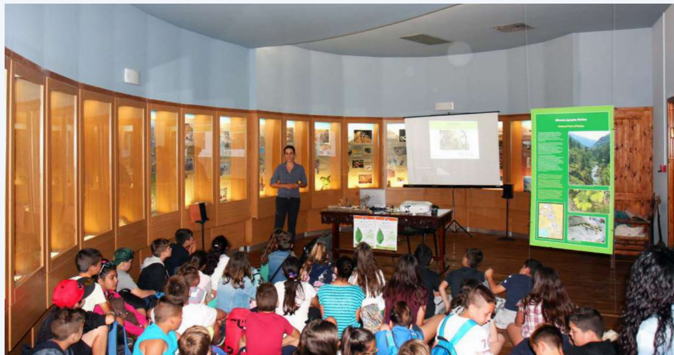
Δράσεις ενημέρωσης και ευαισθητοποίησης (6)