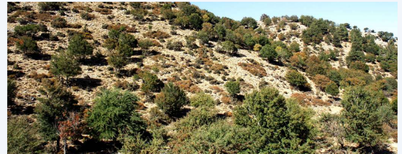
Βιότοπος αμπελιτσιάς – Λευκά Όρη, Ομαλός (2)

Ακολουθώντας σκόπιμα μια αντίστροφη δομή, παρουσιάζουμε αρχικά τις οδηγίες και τις συστάσεις, στη συνέχεια τα αποτελέσματα και τα συμπεράσματα του προγράμματος, έπειτα τους στόχους και τις δράσεις του προγράμματος και καταλήγουμε αναφέροντας γενικά στοιχεία για το είδος.