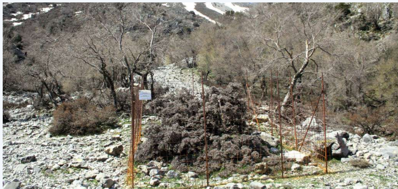
Μικρή περίφραξη - Λευκά Όρη, Ομαλός (8)

ΥΠΑΡΧΟΥΝ ΧΩΡΙΚΕΣ ΔΙΑΦΟΡΕΣ στο ρυθμό ανάπτυξης της αμπελιτσιάς μεταξύ των ορεινών όγκων της Κρήτης,