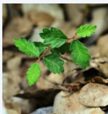
Αρτίβλαστα αμπελιτσιάς στο φυσικό τους περιβάλλον Λευκά Όρη, Ομαλός (10)

ΑΚΟΜΑ ΚΑΙ ΣΤΙΣ ΠΕΡΙΦΡΑΓΜΕΝΕΣ ΕΠΙΦΑΝΕΙΕΣ η επιβίωση των αρτιβλάστων ήταν σπάνια, κάτι που δείχνει ότι τη καλοκαιρινή ξηρασία μπορεί να είναι πιο σημαντικός παράγοντας φθοράς από ότι η βόσκηση.