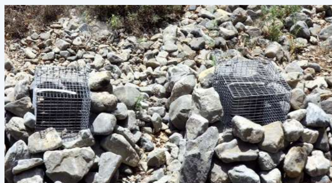
Ατομικές περιφράξεις για την προστασία των αρτιβλάστων αμπελιτσιάς - Λευκά Όρη, Ομαλός (11)