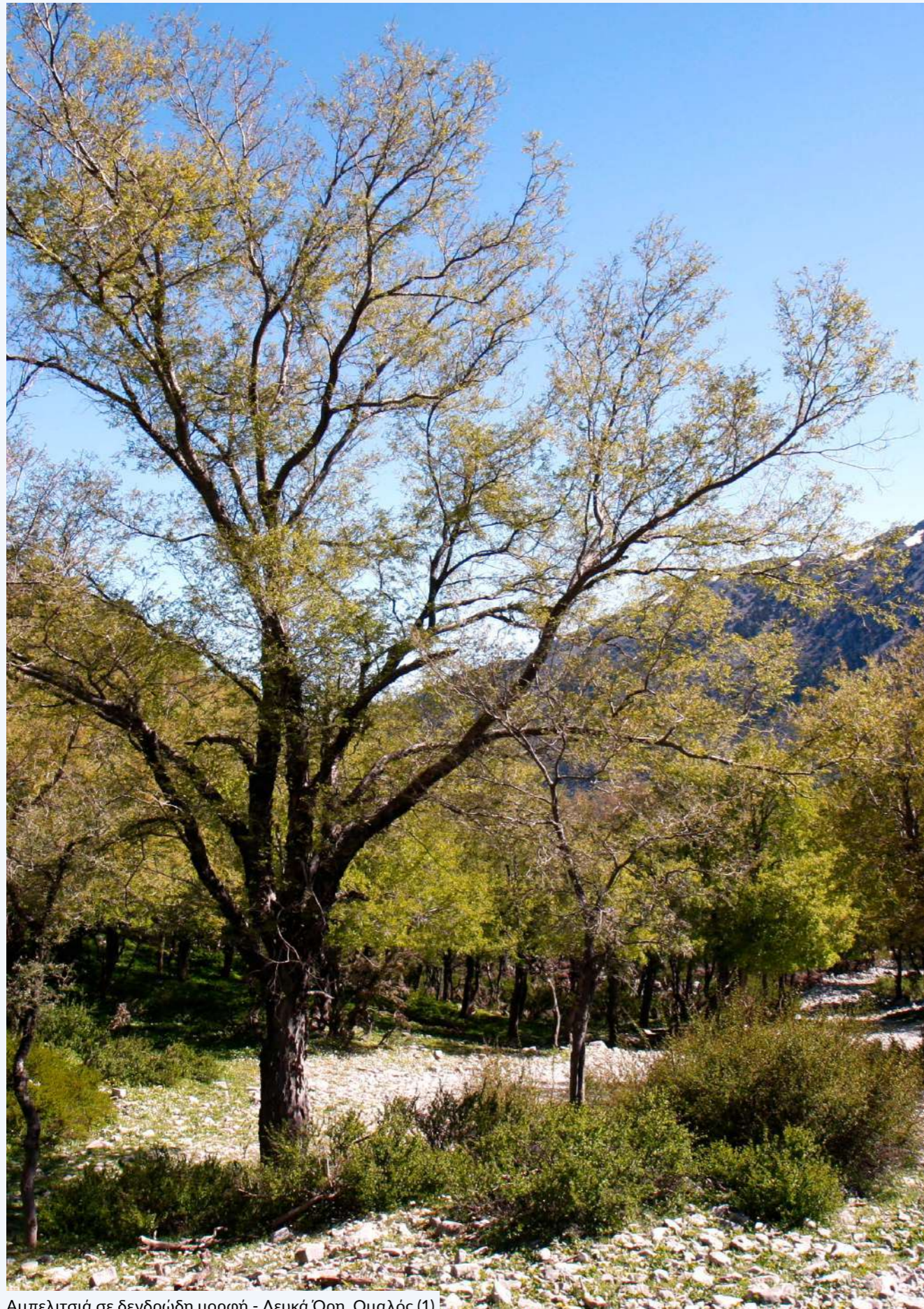
Αμπελιτσιά σε δενδρώδη μορφή - Λευκά Όρη, Ομαλός (1)