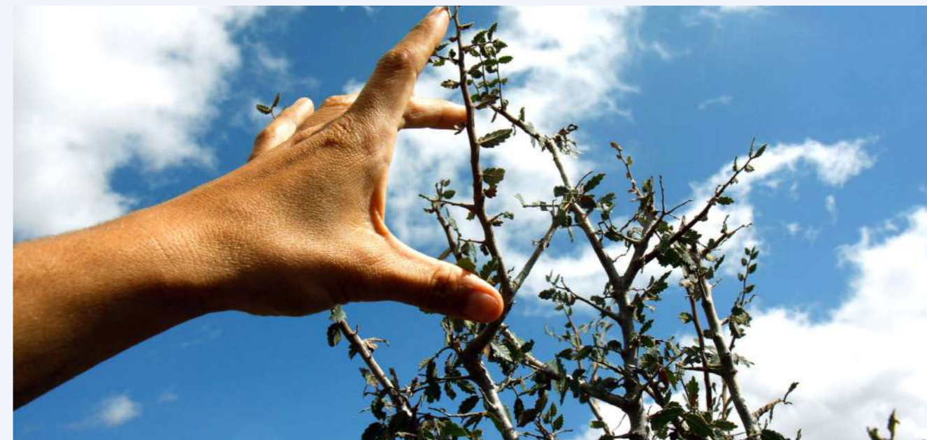
Ανάπτυξη νέων βλαστών αμπελιτσιάς μετά τον αποκλεισμό της βόσκησης (9)

Η ΠΕΡΙΕΚΤΙΚΟΤΗΤΑ ΤΩΝ ΕΔΑΦΩΝ ΣΕ ΘΡΕΠΤΙΚΑ ΣΤΟΙΧΕΙΑ ήταν διαφορετική ανάμεσα σε περιφράξεις που βρίσκονται σε πλαγιές και σε περιφράξεις που βρίσκονται σε δολίνες, αλλά καμία από τις μεταβλητές του εδάφους που ερευνηθήκαν δεν φαίνεται να είναι σημαντική για τον προσδιορισμό των προτύπων ανάπτυξης της αμπελιτσιάς.