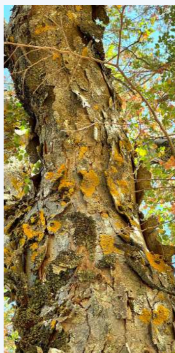
Λειχήνες των ειδών Xanthoria parietina και Pleurosticta acetabulum πάνω σε αμπελιτσιά Λευκά Όρη, Ομαλός (12)

ΠΑΡΑΓΟΝΤΕΣ ΠΟΥ ΕΠΗΡΕΑΖΟΥΝ τις επιφυτικές κοινότητες που αναπτύσσονται στην αμπελιτσιά είναι η γεωγραφική θέση και η μορφή του δέντρου (θαμνώδης ή δενδρώδης μορφή),