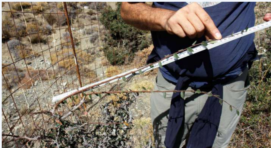
Παρακολούθηση ετήσιας ανάπτυξης αμπελιτσιάς (16)