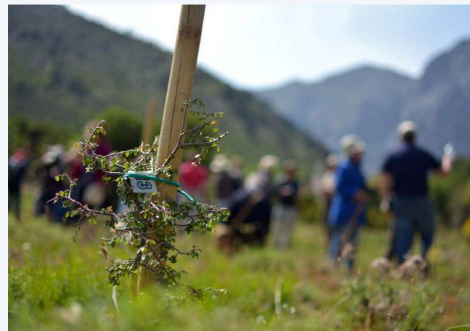
Φυτεία αμπελιτσιάς – Λευκά Όρη, Ομαλός (13)

Η ΔΙΑΣΦΑΛΙΣΗ ΤΗΣ ΔΙΑΤΗΡΗΣΗΣ ΤΗΣ ΓΕΝΕΤΙΚΗΣ ΠΟΙΚΙΛΟΤΗΤΑΣ του είδους δεν μπορεί να βασίζεται μόνο στη διαθεσιμότητα φυτικού υλικού που προέρχεται από σπέρματα.